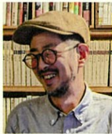
パネルディスカッション パネリスト

富山大学学術研究部疫学・健康政策学講座助教（医学博士）。富山パレレルキャリア研究会代表、NPO法人富山カウンセリングセンター顧問、2020年に若者支援団体の連携組織「一般社団法人若者生きづらさ寄りそいネットワーク協議会」を設立し、現在同協議会理事を務める。主に自殺対策をテーマに地域現場の調査分析を通じた研究活動を実施。