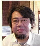
パネルディスカッション パネリスト

NPO法人自立生活サポートセンター・もやい理事長、新宿ごはんプラス共同代表。20代前半よりホームレス状態の方、生活困窮された方への相談支援に関わる。また、生活保護や社会保障削減などの問題について、現場からの声の発信や政策提言を行う。令和3年6月より内閣官房孤独・孤立対策担当室政策参与に就任。