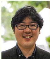
基調講演 講師／ パネルディスカッション コーディネーター