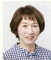
パネルディスカッション パネリスト

2018年に気軽に話せる古本屋を高岡市伏木に開業し、孤独・孤立で悩む方の相談支援を行っている。月に1回自殺を考える会を同店舗で開催するほか、他の支援者の方とも連携し、同店舗を活用したイベント等を開催。