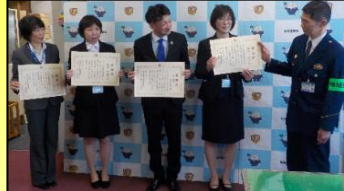
富山銀行水見支店