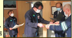
ファミリーマート → 魚津シーサイド店