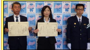
なのはな農業協同組合南部支店