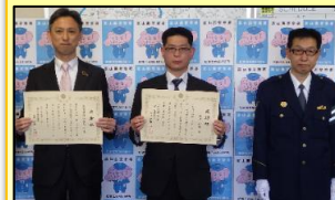
北陸銀行八尾支店