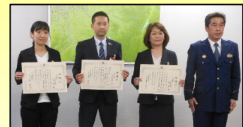
北陸銀行大沢野支店