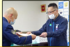
←ファミリーマート 富山綾田町店