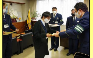
東日本信用漁業協同組合連合会滑川営業店